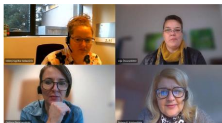
Myndin sýnir dæmi um raunaðstæður í mati sem fer fram í netheimum

Forritið Teams býður upp á ýmsa möguleika sem hægt er að nýta til að hafa samskipti á milli fólks í hópi. Í raunfærnimati þarf að tengja saman fjóra einstaklinga, þátttakendur í raunfærnimati, tvo matsaðila og verkefnisstjóra, eins og sjá má á meðfylgjandi mynd.