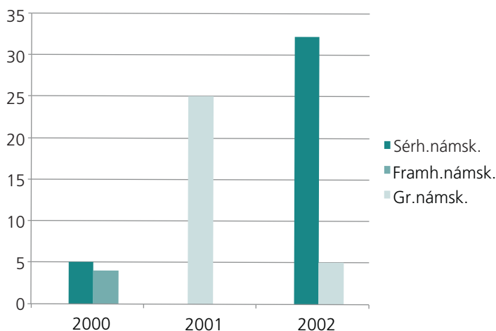
Mynd 2. Fjöldi þátttakenda á námskeiðum frá Sogni á árunum 2001–2003