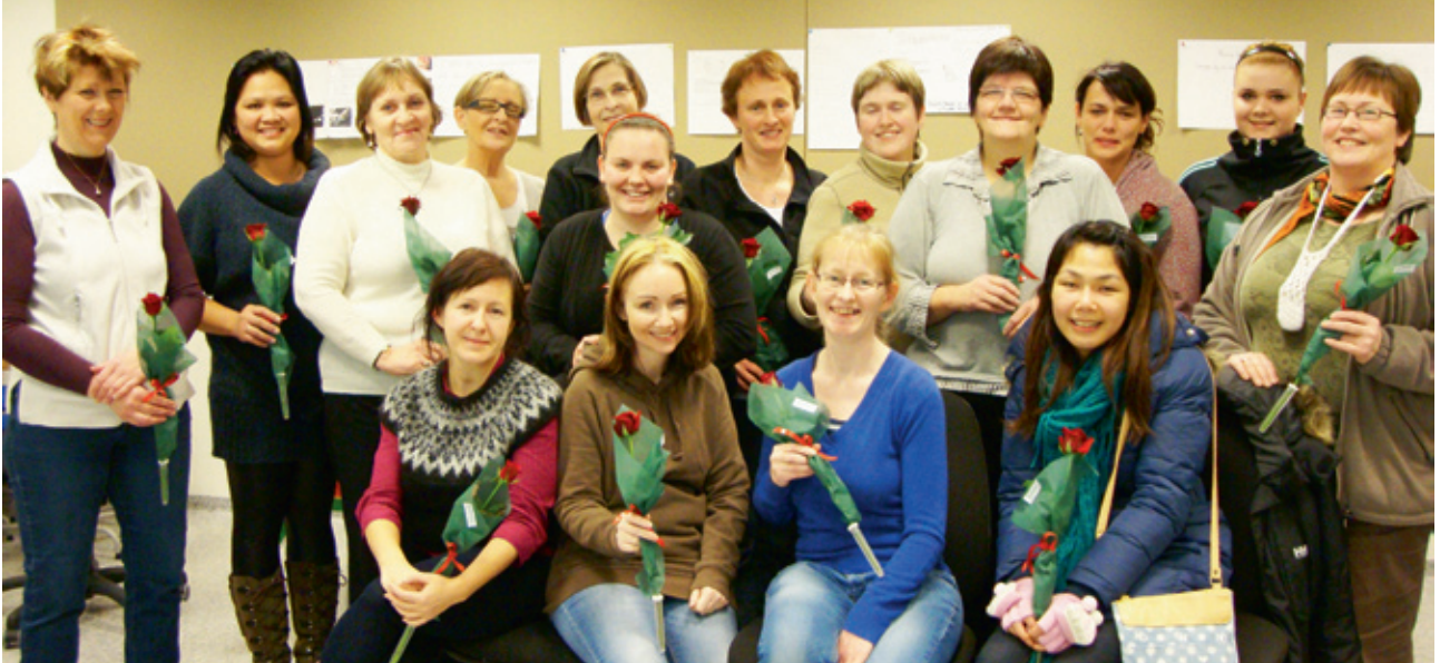
Útskriftarhópur af Fagnámskeiði III haust 2011 ásamt kennara.

áherslu á umönnun og var val námsþáttanna því í samræmi við það. Tölvuþáttur námskeiðsins var tekinn óbreyttur upp.