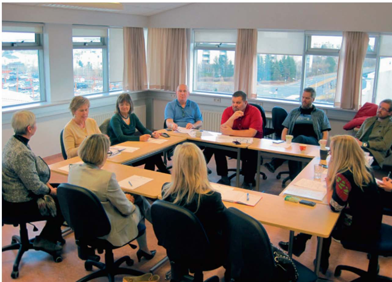
Samstarfsaðilar um nám í ferðaþjónustu.

um allt land og 156 stjórnendur. Svarhlutfall var yfir 60% í báðum hópum. Lélegustu heimturnar voru frá stjórnendum á veitingastöðum með litla þjónustu. Þessum niðurstöðum eru gerð góð skil í grein Þóru Ásgeirsdóttur og Helgu Láru Haarde Hverjir starfa við ferðaþjónustu sem birt er í þessu riti.