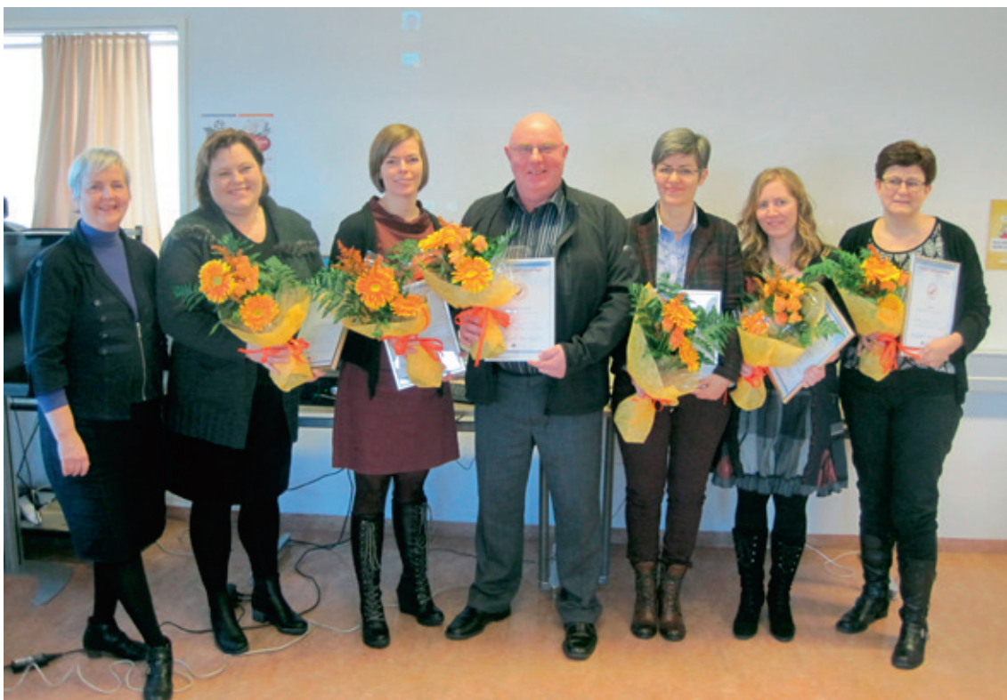
Gæðavottun sex fræðsluáðila í febrúar 2013.

Í Námsnetinu/MySchool er vinnusvæðið Bekkir sérhannað fyrir umsýslu upplýsinga vegna náms samkvæmt námsskrám FA. Á vinnusvæðinu eru stofnaðir bekkir. Kennarar eru skráðir á námskeið. Stundatafla bekkjar er gerð. Hún sýnir tíma, stofu og kennara. Námsmenn eru innritaðir í bekk. Viðvera námsmanna er skráð. Kennarar leggja fyrir verkefni og námsmenn skila verkefnum þegar það á við. Tölvupóstar eru sendir til námsmanna bekkjar. Viðurkenningskjöl eru prentuð í lok náms. Allt þetta og ýmiskonar umsýsla sem fylgir bekkjarnámi fer fram á vinnusvæðinu Bekkir. Upplýsingar um skráningar og námsferla einstaklinga eru geymdar á vinnusvæðinu Nemendabókhald.