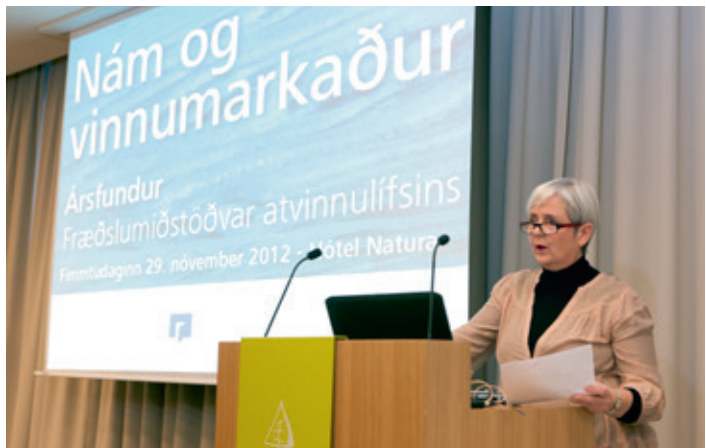
Ársfundur Fræðslumiðstöðvar atvinnulífsins árið 2012 á Hótel Natura.