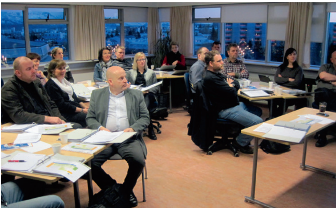
Þjálfun matsaðila í raunfærnimati hjá Fræðslumiðstöð atvinnulífsins.

sérfræðiþekkingu í náms- og starfsráðgjöf innan framhaldsfræðslunnar. Haldnir eru 3–4 samráðsfundir á hverju ári, þar sem unnið er sameiginlega að verkefnum sem stuðla að auknum gæðum og árangri þjónustunnar í þágu markhópsins.