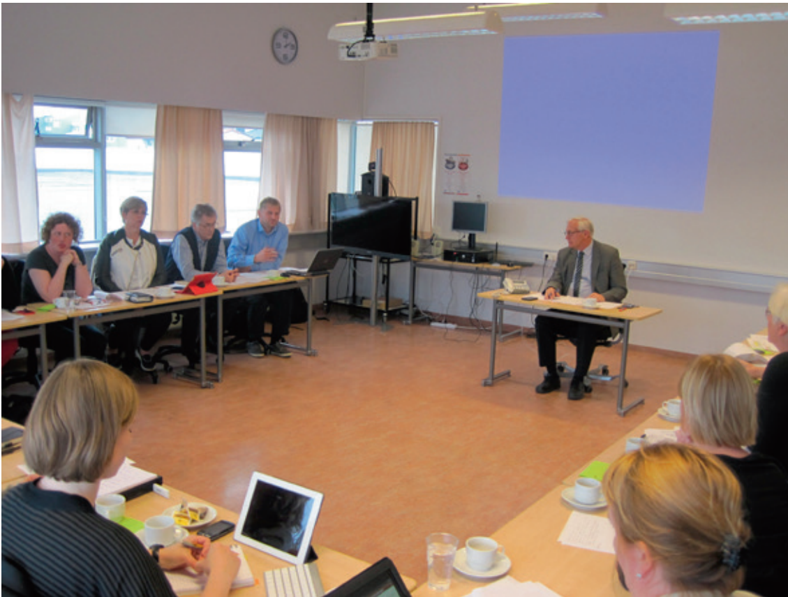
Frá fundi stjórnar Fræðslusjóðs og símenntunarmiðstöðva í júní 2013.

Í vottuðum námsleiðum og raunfærnimati er tekinn saman tvisvar á ári (í janúar og ágúst) og skýrslur unnar úr þeim tölum. Í náms- og starfsráðgjöf er upplýsingum safnað saman ársfjórðungslega.