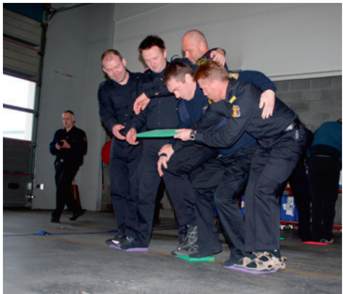
Stiklunemendur úr Brunamálaskólanum, námskeið haldið á Akureyri haustið 2013.