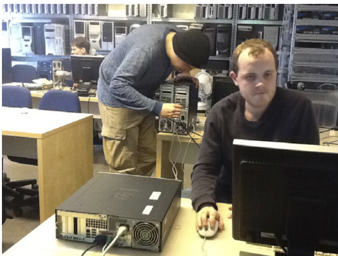
Skyldi þetta virka?