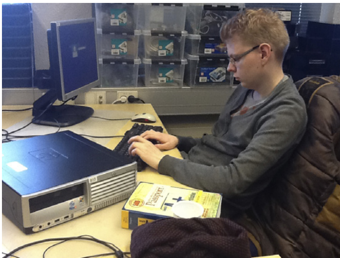
Með námsbókina sér við hlið.

Einnig voru kynntir möguleikar til að sækja um styrk fyrir prófgjöldum og boðin var fram aðstoð við umsóknarferlið.