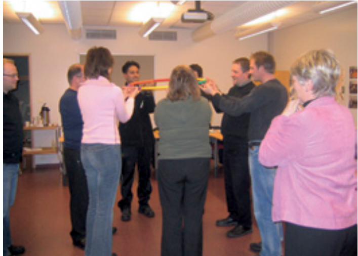
Mynd af námskeiði starfsþjálfra

talið bættu ráðgjöf, eflða grunnþekkingu og samfélagsvirkni).