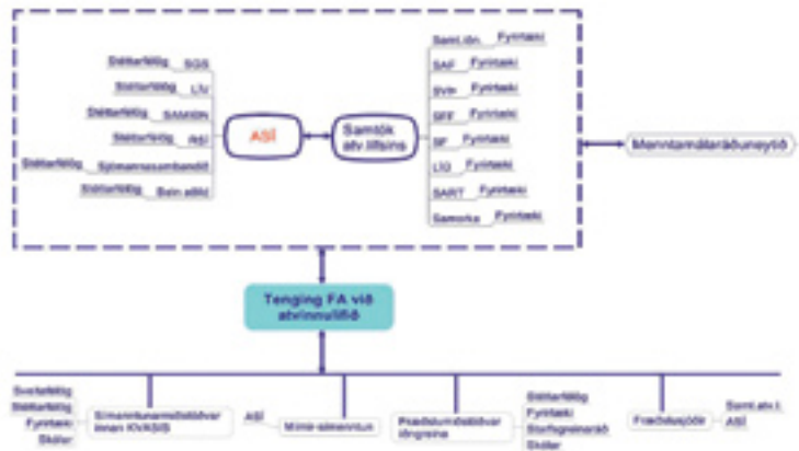
Mynd 3. Tenging FA við atvinnulífið

milljónir af sér í starfseminu og aukið samlegðaráhrif í starfinu til muna. Sjá má á neðangreindri töflu hvað aukning annarra tekna hefur verið mikil á tímabilinu sem hlutfall af framlagi ríkisins til verkefna FA.