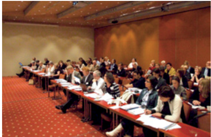
Mynd frá lokaráðstefnu VOW.

Stjórn verkefnisins er í höndum Spánverja. Sjá heimasíðu verkefnisins, creacproject.or .