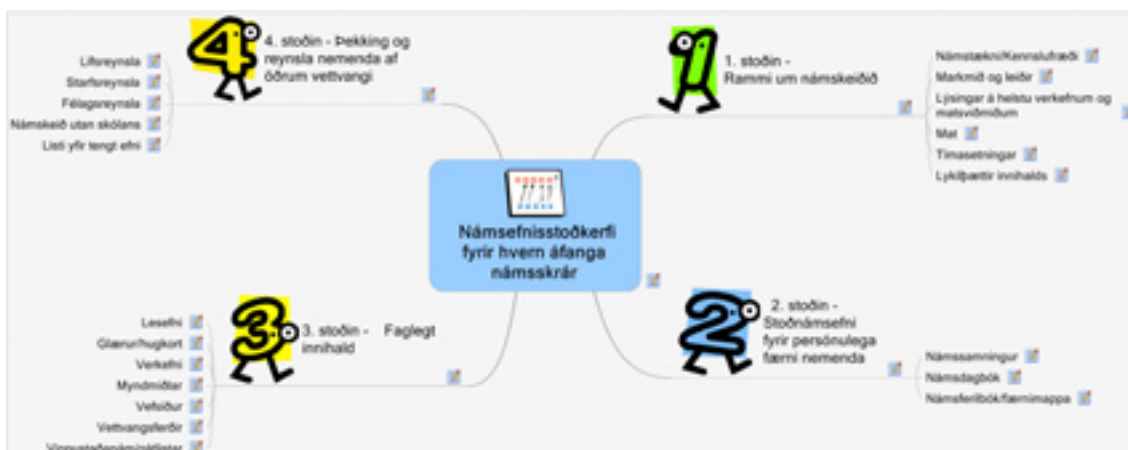
Mynd 4. Námsefnisstoðkerfi