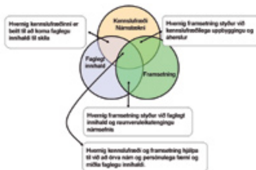
Mynd 2. Sviðin þrjú og skörun þeirra

Alltaf mun það verða afstætt hvað telst fullnægjandi samkvæmt lágmarkskröfum en viðmiðin í mælistikunni