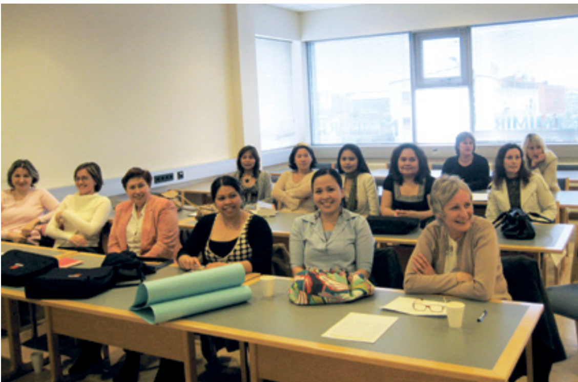
Félagliði í nýju landi. Hópmýnd af fyrstu nemendum í nýrri félagsliðabru fyrir fólk með annað móðurmál en íslensku.