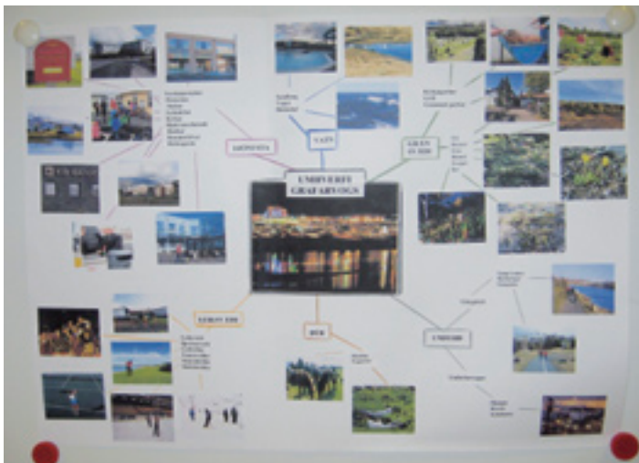
Hugarkort um umhverfi Grafarvogs og alla möguleika sem það býður upp á.

kennara í íslensku voru lesnir valdir kaflar úr bókinni til að þjálf lestrartækni en aðaláherslan var á að vinna með hugtök úr faginu. Það var gert með því að vinna orðalista úr köflunum, nota orðabanka, orðavegg og hugarkort. Orðalistar gátu verið með ýmsu móti, unnir af kennaranum með eða án orðskýringa og dæma eða unnir af nemendum í para- eða hópavinnu þar sem þeir unnu saman að því að útskýra hugtök með dæmum. Hópurinn kom oft með tillögur að orðalagi eða dæmi til að útskýra hugtök. Orðabanki er persónulegur orðabanki hvers og eins nemanda