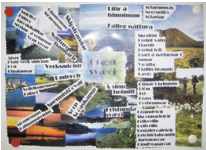
Hugarkort um græn svæði í borginni: (Hvað þau bjóða upp á og hvaða hætta stæðjar að þeim úr umhverfinu.)