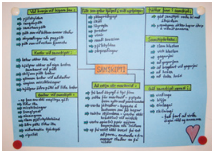
Hugarkort um samskipti út frá mörgum sviðum.

Árangurinn af fyrstu önn í verkefninu Félagsliði í nýju landi var góður. Reynslan sýndi að fjölbreyttar kennsluáðferðir gagnast öllum nemendum því það að hafa íslensku sem annað tungumál er einungis einn þáttur í fjölmenningu hópsins. Fullorðnir námsmenn hafa ólíka lífsreynslu og mismikla skólagöngu að baki auk þess sem hindranir í námi og væntingar til námsins geta verið af mjög ólíkum toga. Verkefnið þróast áfram og fleiri náms- og kennsluleiðir verða notaðar á næstu önnum sem munu vonandi nýtast öllum kennurum og nemendum á félagsliðabru í framtíðinni.