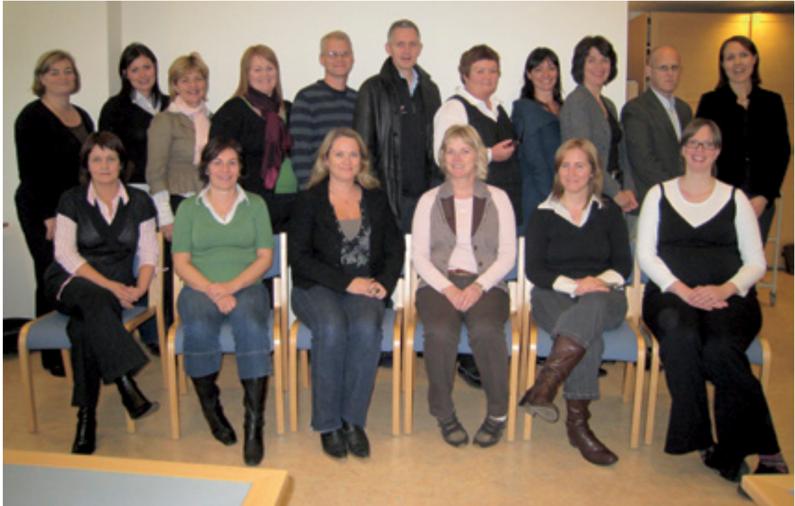
Mynd 4. Ráðgjafahópurinn á fræðsludegi

einstaklingar hafi þekkingu á eigin færni og þor til að þróa hana áfram. Náms- og starfsráðgjafar geta boðið upp á Færnimöppugerð fyrir einstaklinga og hópa. Þátttaka í slíku tilboði er skref í átt að virkri færniuppbyggingu.