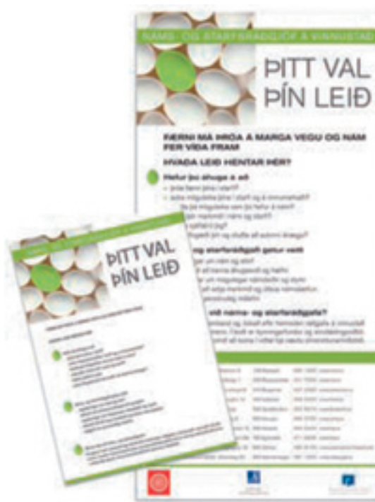
Mynd 3. Kynningargögn fyrir Náms- og starfsráðgjöf á vinnustað

Vandi, sem margir sem fást við fullorðinsfræðslu glíma við, er að finna leiðir til þess að hvetja fólk til náms. Ein leið, sem vert er að minnast á hér, er Færnimappan. Mímir – símenntun hefur boðið upp á færniöppugerð sem gengur út á að einstaklingar skrá færni sína og safna saman gögnum henni tengdri í þar til gerða möppu. Það ferli, sem færnisráning af þessu tagi býður upp á, veitir einstaklingnum yfirsýn yfir þá færni sem hann hefur þróað með sér í gegnum hin ýmsu störf, nám, félags- og fjölskyldulíf. Það hefur sýnt sig að þeir sem fara í gegnum færniöppugerð (einnig hluti af raunfærnimatsferlinu) finna margir hverjir fyrir innri hvatningu til áframhaldandi færniuppbyggingar. Að gera færniöppu felur í sér sjálfstyrkingu undir rétttri handleiðslu, sem ýtir undir sjálfsþekkingu og sjálfstraust til náms. Það er hagur einstaklingsins, fyrirtækja og samfélagsins að starfsmenn/