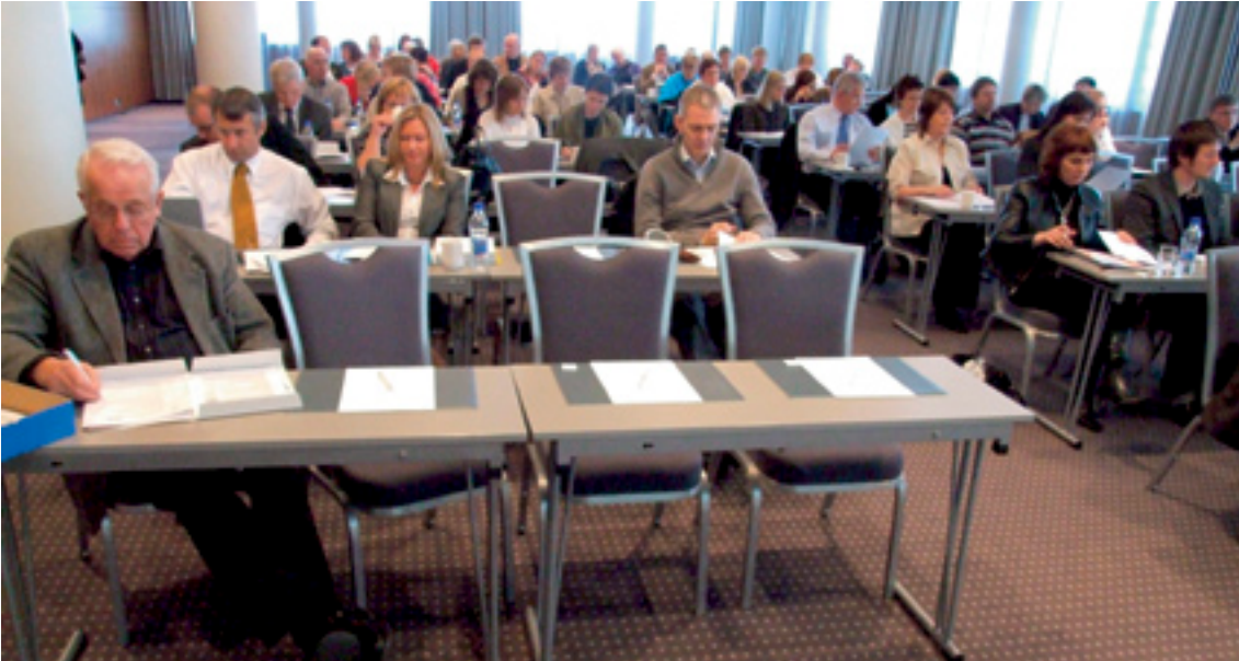
Mynd 4. Þátttakendur á norrænni ráðstefnu um raunfærnimat í maí 2007.