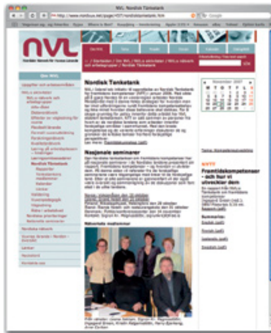
Mynd 1. Heimasíða NVL, http://www.nordvux.net/

NVL heldur úti öflugri heimasíðu, www.Nordvux.net . Þar eru upplýsingar um hvaðeina viðvíkjandi fullorðinsfræðslu auk upplýsinga um starfsemi NVL og vinnuhópa á þeirra vegum. Hægt er að leita að efni eftir leitarorðum á öllum Norðurlandamálunum og ensku. Þar er einnig að finna bæði rafrænt fréttabréf NVL og tímaritið DialogWeb. Fréttabréfið er á finnsku og íslensku og ein útgáfa er á dönsku, norsku eða sænsku. Það kemur út ellefu sinnum á ári; fulltrúar landanna safna og miðla fréttum hver frá sínu landi. DialogWeb kemur út átta sinnum á ári á rafrænu