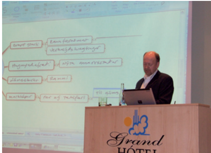
Greinarhöfundur á ársfundi FA 2007.

Þrátt fyrir að Fræðslumiðstöðin bjóði ekki upp á námskeið fyrir markhóp sinn heldur hún námskeið fyrir kennara sem kenna markhópnum. Þetta er í takt við framkvæmd stofnunarinnar, að sinna markhópnum með því að stuðla að því að framkvæmdaðilar séu betur í stakk búnir til að veita góða þjónustu. Það er reynsla þeirra sem vinna við fræðslu fullorðinna að til þess að vel takist til þurfi kennarar fullorðinna námsmanna að setja sig inn í sérstaka stöðu fullorðinna námsmanna því að hvort sem menn hafa lært kennslufræði eður ei hættir þeim gjarnan til að kenna fullorðnum á sama hátt sem þeim var sjálfum kennt í skóla. En til þess að ná sem bestum árangri með markhóp Fræðslumiðstöðvarinnar er mikilvægt að nálgast hann á annan hátt en í hefðbundnu skólastarfi. FA hefur því haldið fjölda námskeiða um kennslufræði fullorðinna víða um landið fyrir kennara í fullorðinsfræðslu.