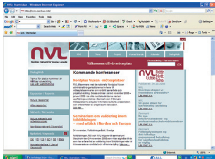
Heimasíða NVL, www.nordvux.net .

Það kemur skýrt fram í stefnu FA að stofnunin ætli ekki að starfa beint með markhópnum heldur að starfa með og styðja við þá sem eru í beinum tengslum við markhópinn. Þannig hefur Fræðslumiðstöðin stofnað til tengsla við sérfræðinga og stofnanir sem vinna á ýmsan hátt að fullorðinsfræðslu og að málefnum sem snerta markhópinn. Með því að kalla til fólks eða bjóða því til samstarfs nær stofnunin að eignast bandamenn á ólíklegustu stöðum. Vissulega eru flestir nátengdir fræðslumálum fullorðinna en þar fyrir utan má nefna verkstjóra og aðra stjórnendur í fyrirtækjum, sérfræðinga hjá stéttarfélögum og öðrum félagsamtökum atvinnulífsins sem boðið er að taka þátt í ýmsum verkefnum sem tengjast námi fullorðinna. Allt þetta fólk verður ósjálfrátt sendiherrar FA en ekki síst málefna sem stofnunin hefur tekið að sér. Það má því færa fyrir því sannfærandi rök að þeir hinir sömu virki sem málsvarar margra þeirra málefna sem Fræðslumiðstöðin stendur fyrir og auki þannig áhrifamátt stofnunarinnar.