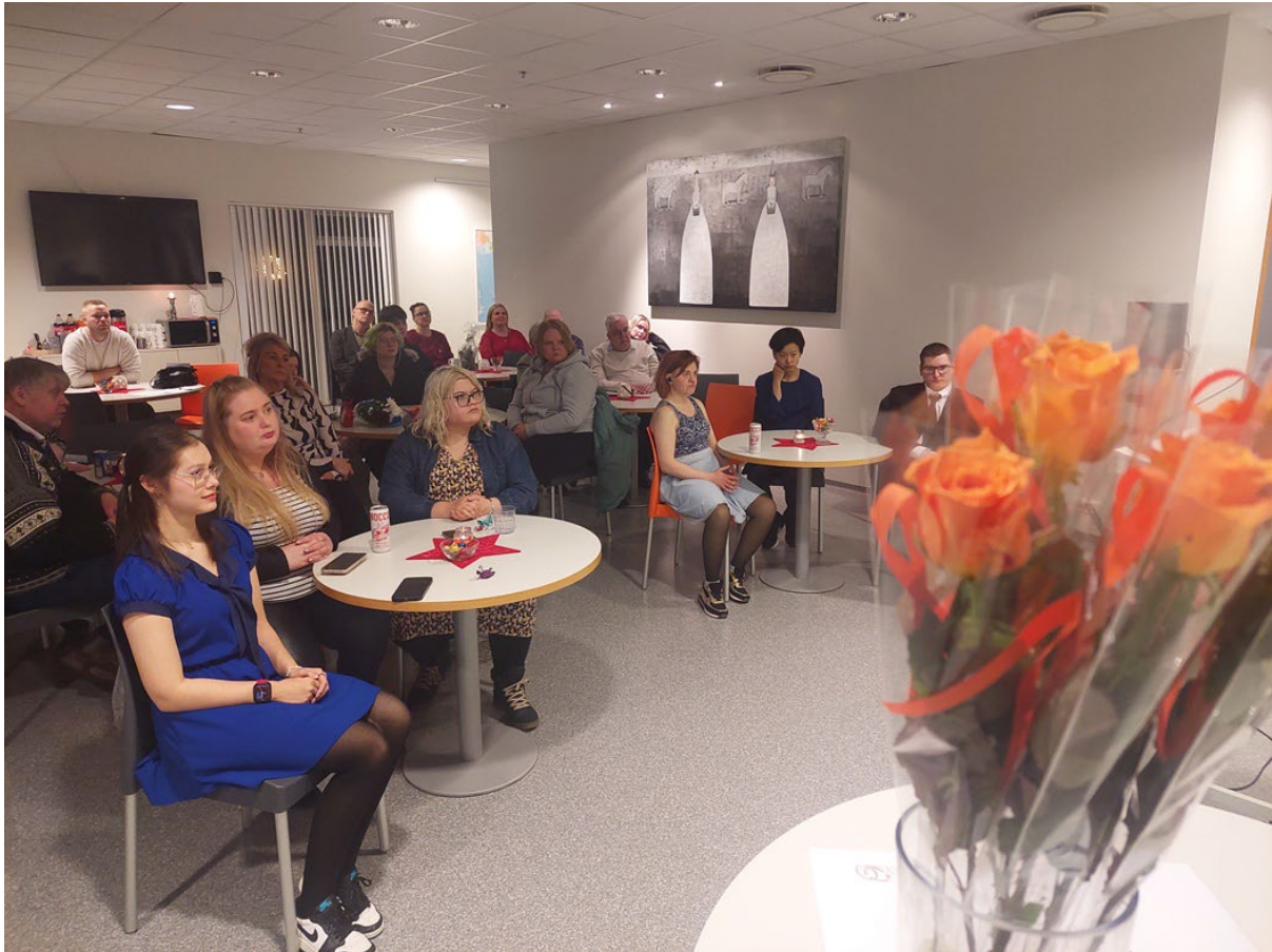
Frá útskrift hóps úr Færni á vinnumarkaði á Akureyri